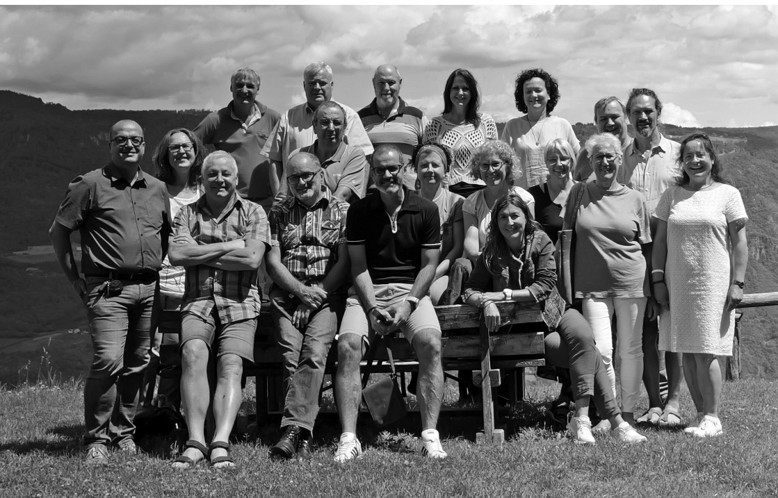
Il direttivo AGO

Con i migliori saluti Il vostro Presidente Provinciale